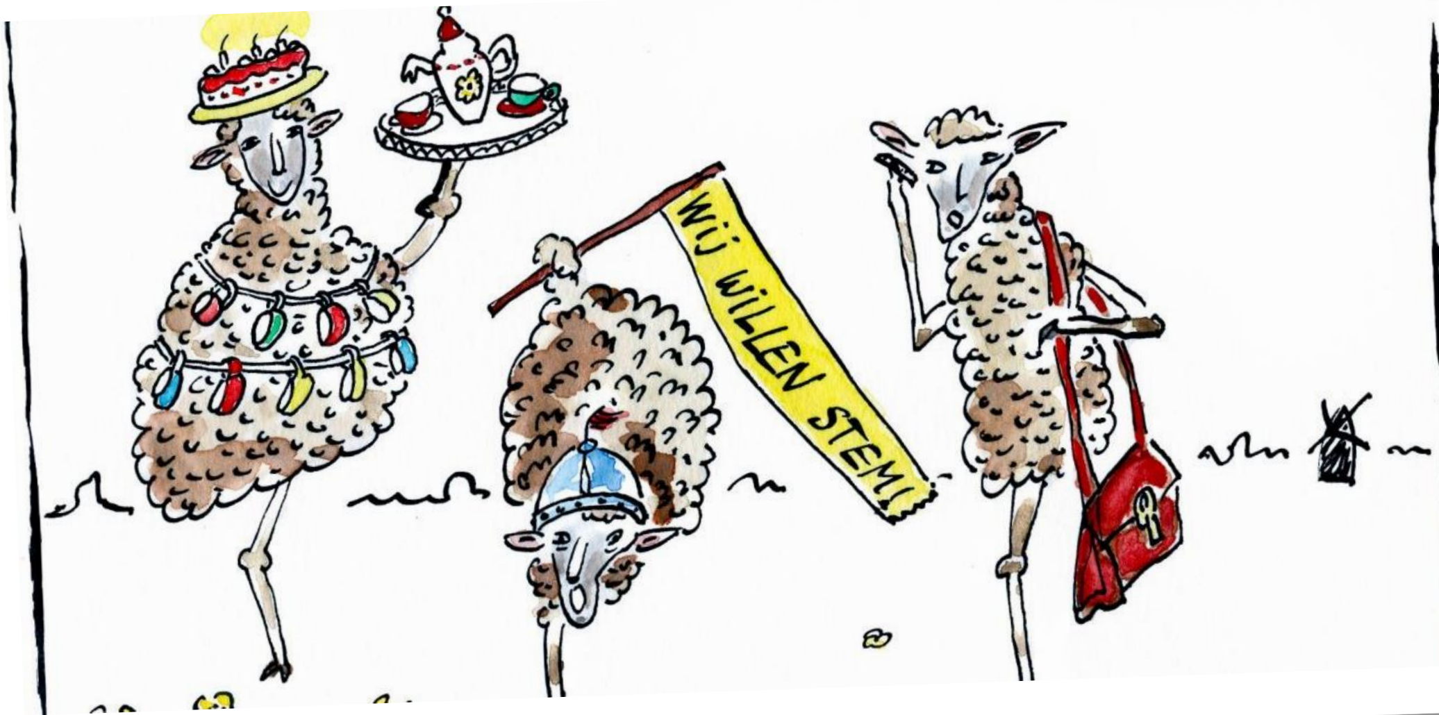
Illustratie: Leontine Hoogeweegen, www.tienstekenlab.nl